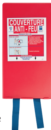
Couverture anti-feu CODE : 731 002