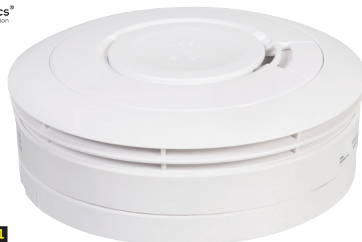
CATA 2016 p.961