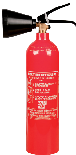
1 CATA 2016 p.650