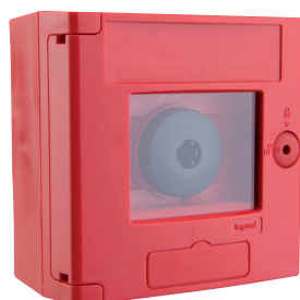
Coffret double position CODE : 331 632