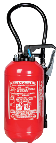
3 CATA 2016 p.651