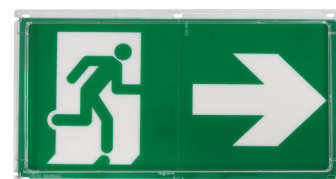
2 CATA 2016 p.974