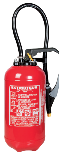
2 CATA 2016 p.650