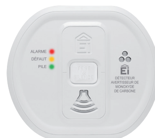
Détecteur de monoxyde de carbone CODE : 156 014