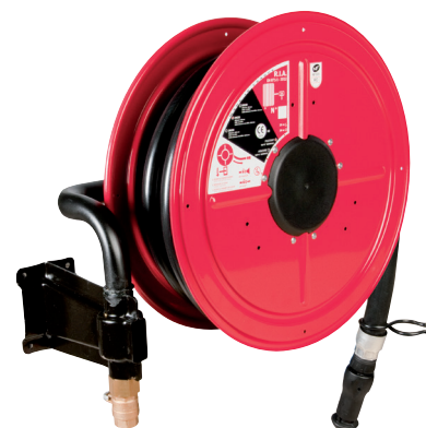
2 CATA 2016 p.652