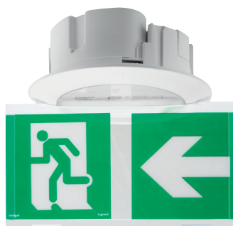
1 CATA 2016 p.973