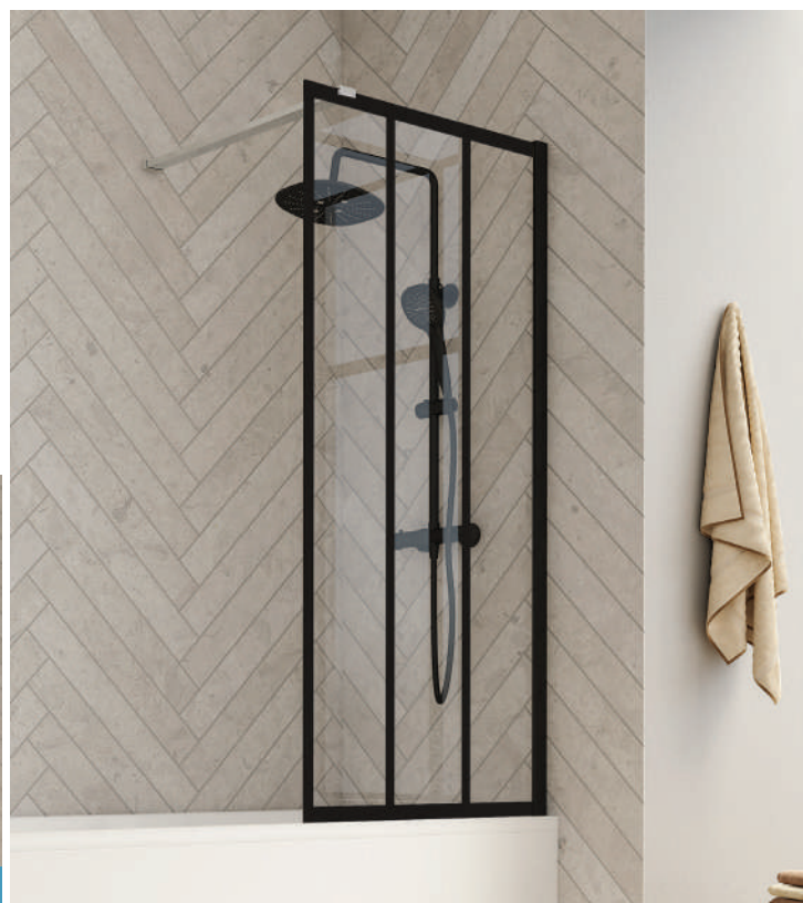
Smart Design Hydra - profilé gris noir grainé - verre factory