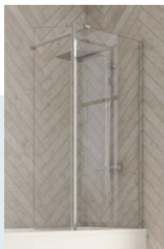
Smart Design Hydra avec volet pivotant - profilé chromé