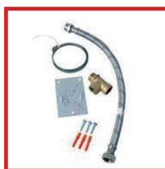
Kit d'installation pour vase d'expansion sanitaire