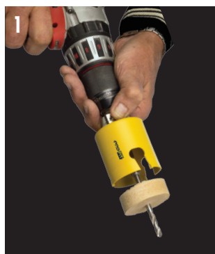
EJECTER LA CAROTTE EN UN TOUR DE MAIN