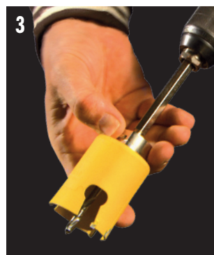
CHANGER DE TRÉPAN RAPIDEMENT