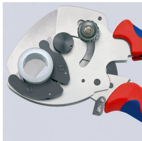
Coupe nette de tubes en plastique et tubes Multicouche à paroi épaisse

Sous réserve de toute modification technique et erreur.