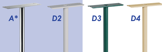
*A2, piquet spécial pour modèles : Picardie, Pavillon Campagne (petits et grands modèles)