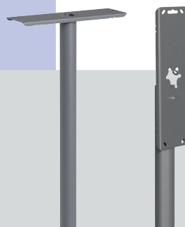
U 800 Piquet Brabantia