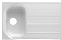
03 : BLANC MOUCHETÉ