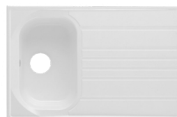
17 : BLANC UNI