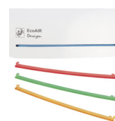
Réglettes de façade interchangeables fournies avec l'aérateur Grâce aux réglettes de façade interchangeables, votre client pourra choisir son décor.