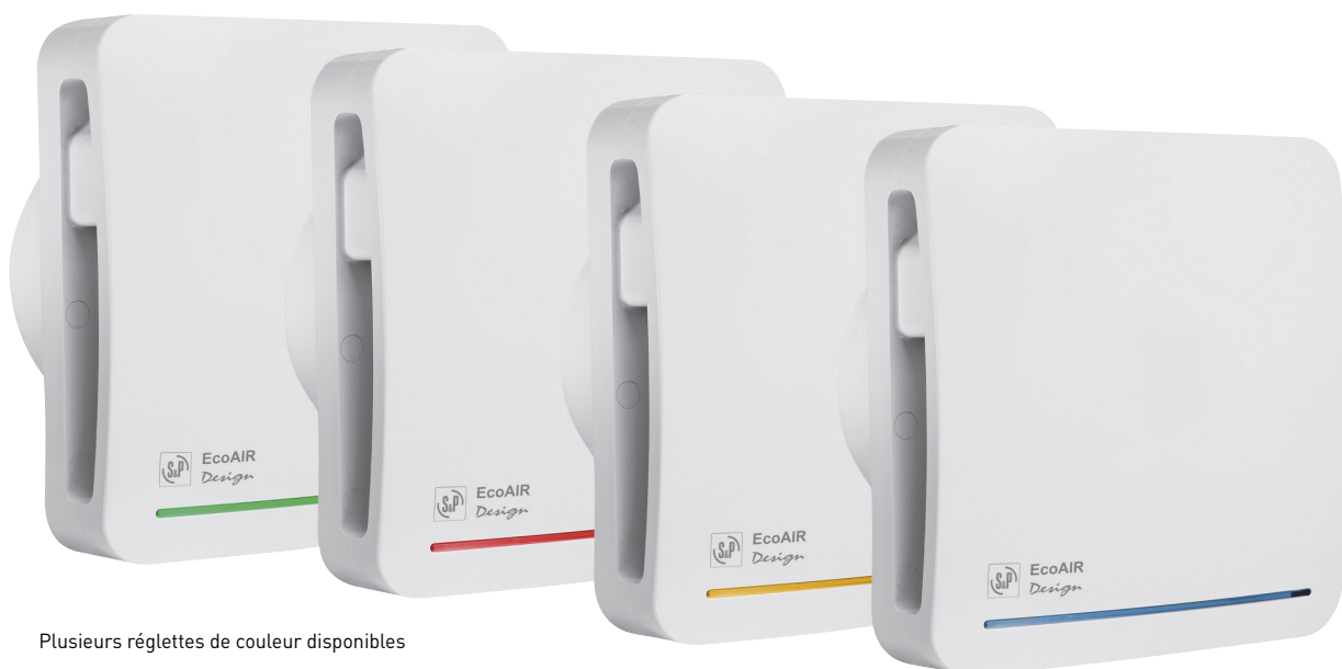
Plusieurs réglettes de couleur disponibles