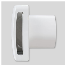
Silent-blocs élastiques Moteur monté sur silent-blocs élastiques qui absorbent les vibrations.