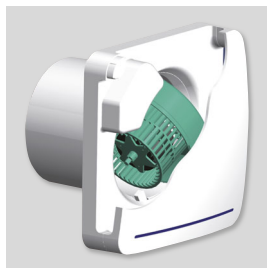
Turbine centrifuge à action Permet de fournir un débit important avec un faible niveau sonore.