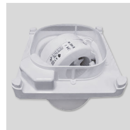
Filtre à l'aspiration Filtre amovible et lavable, en maille plastique, pour protéger le ventilateur des poussières.