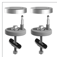
Kit Charnières 777109