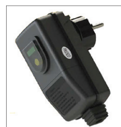
PLUG &amp; PLAY 220 V