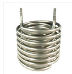
Échangeur en titane