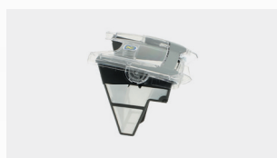
Bac filtrant 3 litres débris fins 100 µ Detriti fini 100 µ (3L)