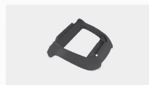
Socle pour boîtier de commande Quadro di comando