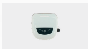
Boîtier de commande Quadro di comando