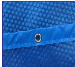
CVKPCO41 Couverture isotherme Isothermische afdekking