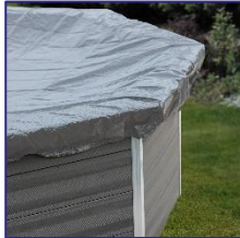
CIKPCO41 Couverture d'hiver Winterafdekking