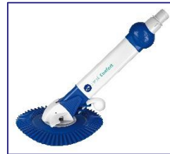
Nettoyeurs automatiques Automatische zwembadreiniger