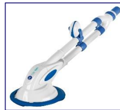
Nettoyeurs automatiques Automatische zwembadreiniger