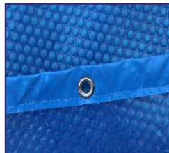
CVKPCOR28 Couverture isotherme Isothermische afdekking