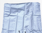
Housse de protection