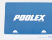
Coffret d'entretien incluant le manuel d'utilisation multilingues