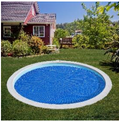
CVPE420 Bâche isotherme Isothermische afdekking