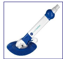
Nettoyeurs automatiques Automatische zwembadreiniger