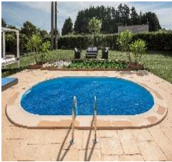
CVPE700 Bâche isotherme Isothermische afdekking