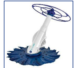
Nettoyeurs automatiques Automatische zwembadreiniger