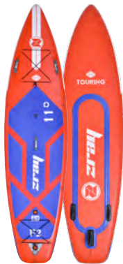
FURY PRO 11'