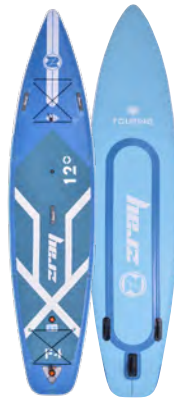
FURY EPIC 12'