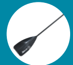
Pagaye 3 sections