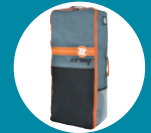
Sac de transport