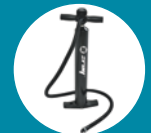
Pompe haute pression