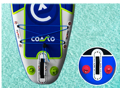
DOUBLE ELASTIQUE CHARGEMENT