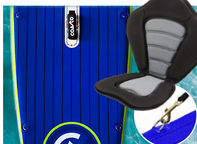
OPTION SUP HAYAK