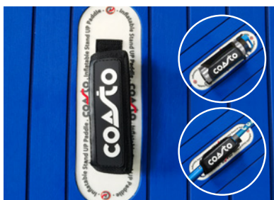
POIGNEE CENTRALE 2 EN 1