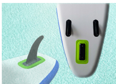
2 AILERONS + AILERON AMOVIBLE