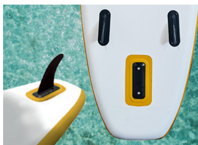
2 AILERONS + AILERON AMOVIBLE