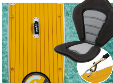
OPTION SUP KAYAK