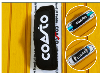
POIGNEE CENTRALE 2 EN 1