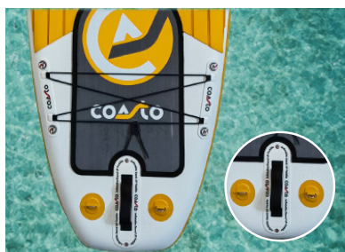
DOUBLE ELASTIQUE CHARGEMENT