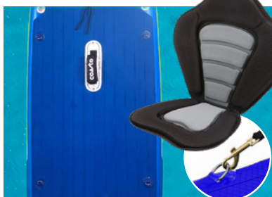
OPTION SUP KAYAK