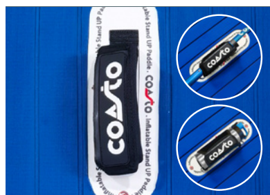
POIGNEE CENTRALE 2 EN 1