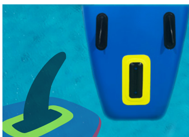
2 AILERONS + AILERON AMOVIBLE