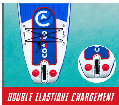
DOUBLE ELASTIQUE CHARGEMENT