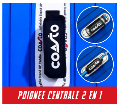
POIGNEE CENTRALE 2 EN 1