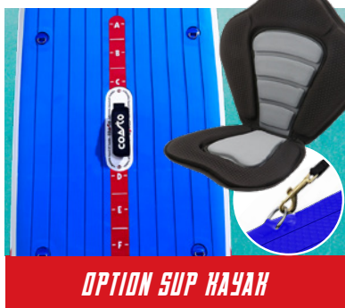
OPTION SUP KAYAK