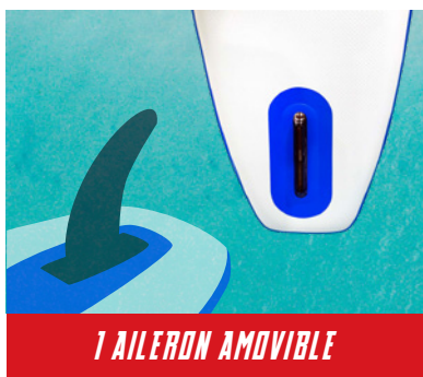
1 AILERON AMOVIBLE