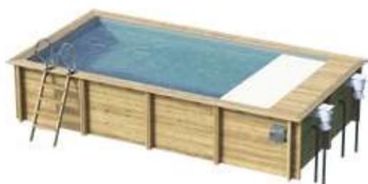
Version exclusivement hors-sol