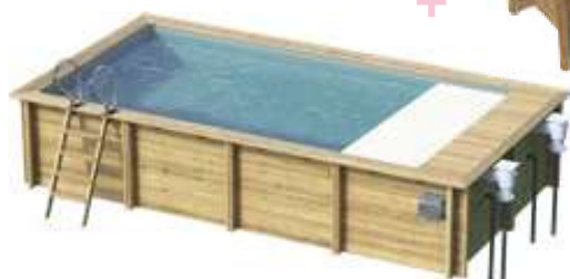
Coffre obligatoire pour version enterrée ou semi-enterrée (voir page 15)