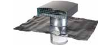
Sortie de Toit Standard

La sortie de toit standard a été conçue pour la VMC et le traitement d'air dans les logements collectifs et les immeubles tertiaires.