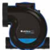
Groupe MW en vue de dessus