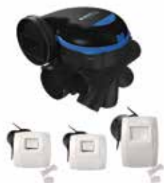
Kit MW avec grilles BAHIA Curve CORD

EasyHOME HYGRO Premium est une solution de ventilation hygroréglable pour combles, très basse consommation, disponible en version Haute Pression, qui vous accompagne dans le cadre de projets RE2020.