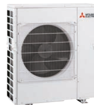
MXZ-4E83VAHZ MXZ-4F83VFHZ 4 connexions