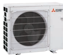
MXZ-2E53VAHZ MXZ-2F53VFHZ 2 connexions